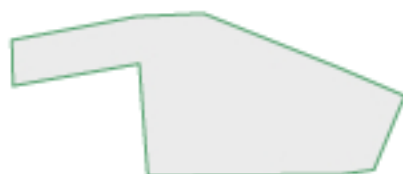
Схема земельного участка

Удаленность: Горьковское шоссе - 5 км, МКАД - 60 км.